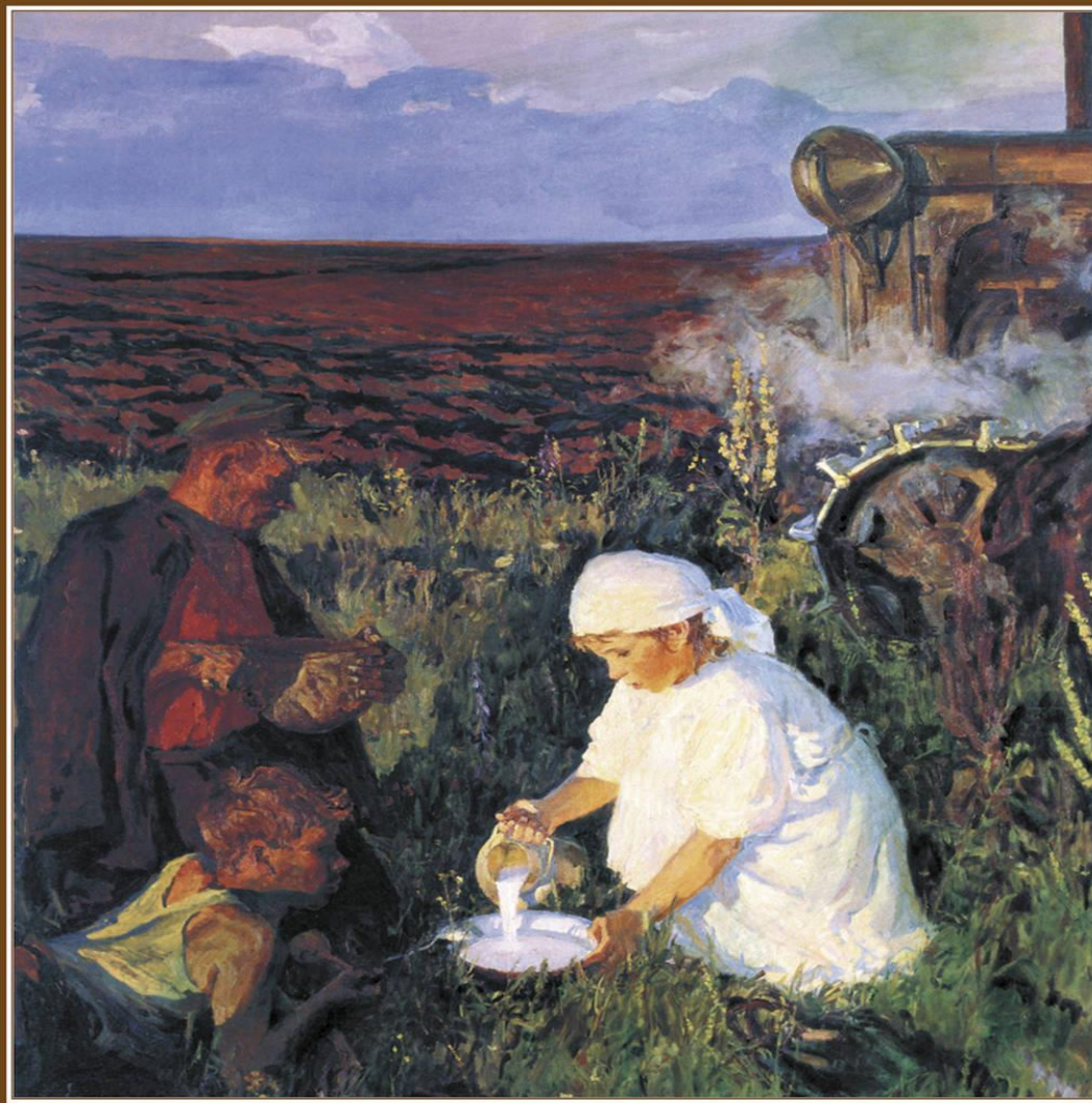
А. Пластов. Ужин тракториста