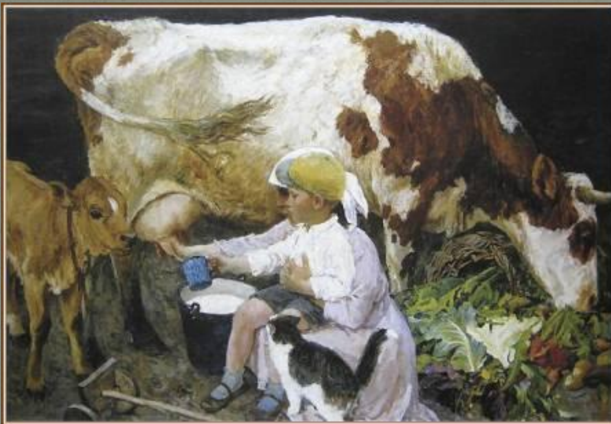
А. Пластов. Кружка молока

Рассмотри репродукции картин А.А. Пластова. О каких трудовых семейных традициях рассказывают они? Расскажи о героях картин.