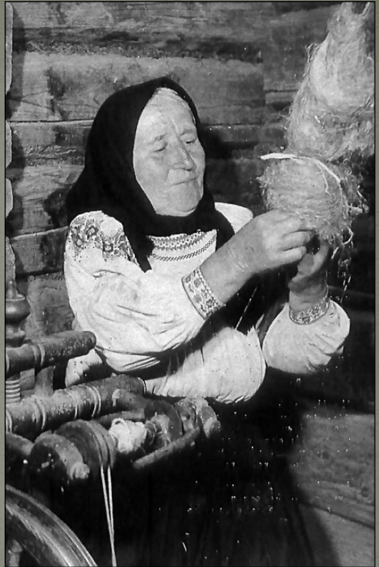
За прялкой. Старинная фотография